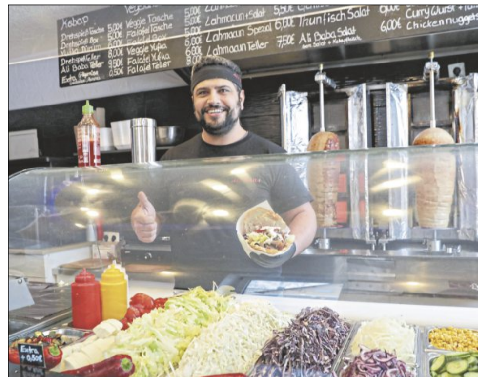
Auf Platz drei: Auch bei Ali Baba in der Untermühlstraße schmeckt der Döner sehr gut.