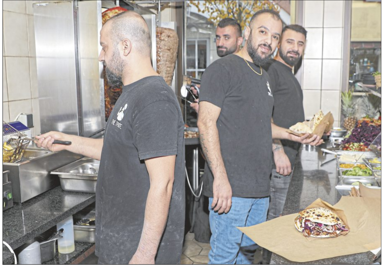
Bei The Taste in der Wilhelmstraße gibt es laut der Welzheimer Zeitung den besten Döner. Wer kann dem subjektiven Urteil folgen?

Das frische und selbst gemachte Brot, die Auswahl an gut gegrilltem Fleisch, die eigenen Soßen (nicht aus dem Großmarkt), das frische Gemüse mit einer großen Auswahl und das Anrichten auf einem Teller sind bei