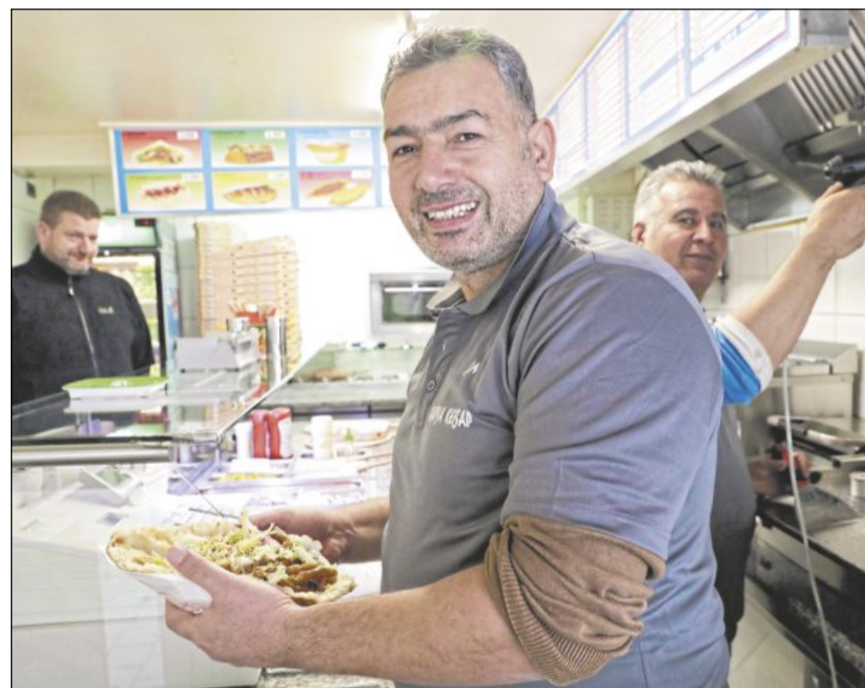
Auf Rang zwei: Bei Alanya Döner Kebab in der Gemeindehausstraße ist der Döner lecker.

Wer seine Eindrücke öffentlich mitteilen möchte, kann dies auf der Facebook-Seite des Zeitungsverlags Waiblingen unter dem Kommentar des Artikels tun oder eine E-Mail schreiben an welzheim@zvw.de . Unter allen Einsendungen wird dann ein neues Ranking veröffentlicht.