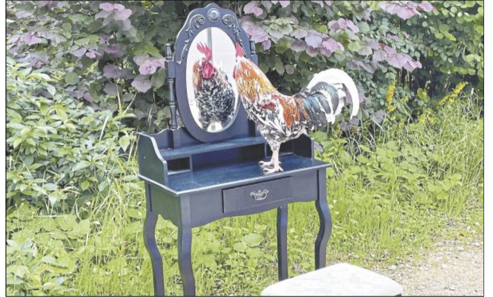
„Elvis im Spiegel“: Eine der neuen Installationen im Eins + Alles.