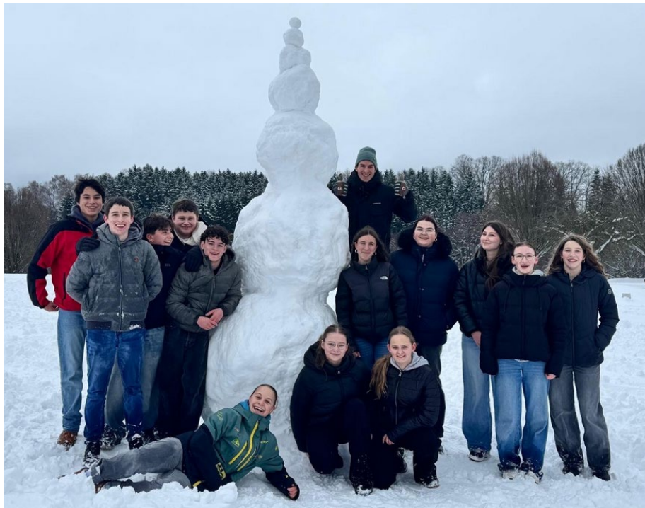
Not macht erfinderisch – unser Umgang mit dem „Schnee-Chaos-Tag“

Schließen möchten wir mit zwei Impressionen aus jüngster Vergangenheit: