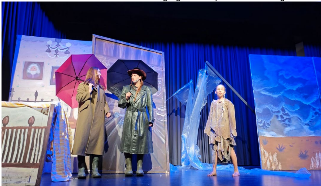
„Das letzte Geleit“ das diesjährige Stück unserer Theater AG als Kulturbeitrag im Welzheimer Wald