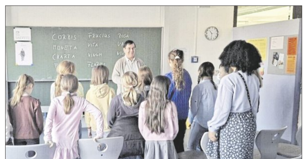
Das Limes-Gymnasium führt nicht nur die römische Geschichte im Namen, sondern bietet auch Lateinunterricht an.

Zum Abschluss kamen alle Gäste in der Aula zusammen und nutzten die Gelegenheit zum Austausch. Die Beteiligten waren sich einig: Das Limes-Gymnasium Welzheim ist ein Ort des gemeinsamen Lernens, der Neugier und des Miteinanders - und ein starker Begleiter beim Eintritt in die weiterführende Schule.