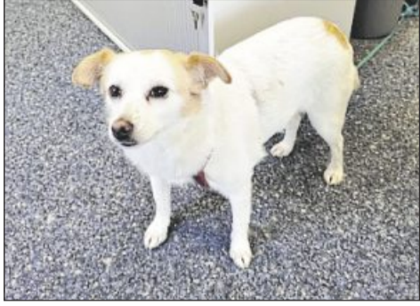
Dieser Hund war entlaufen - und trug keine Hundemarke. Das veranlasste die Stadt Welzheim, auf ihrer Webseite über richtiges Vorgehen zu informieren. (Archivbild)